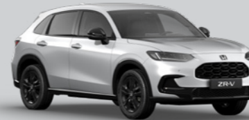
DIAMOND DUST PEARL