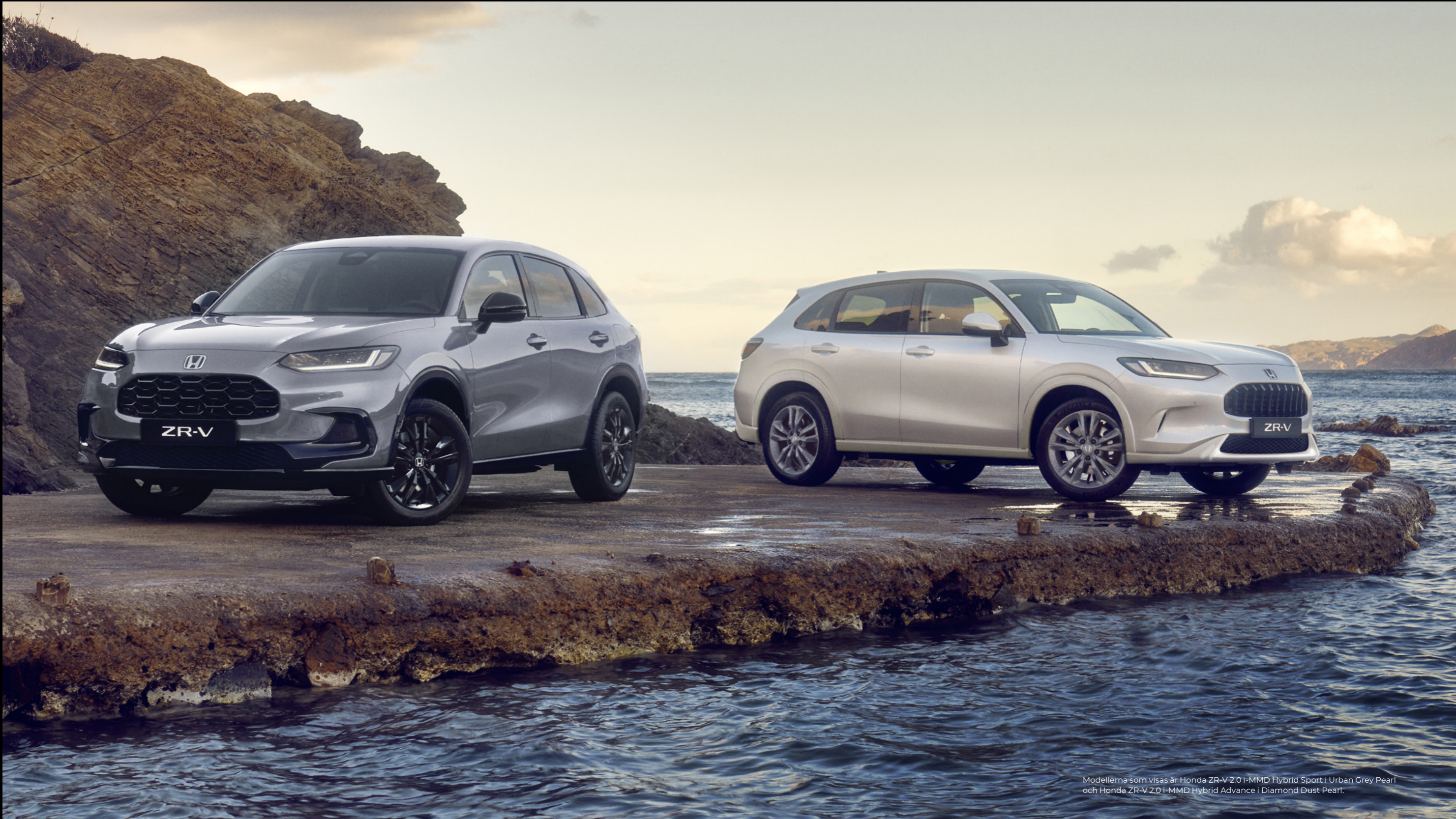
Modellerna som visas är Honda ZR-V 2.0 i-MMD Hybrid Sport i Urban Grey Pearl och Honda ZR-V 2.0 i-MMD Hybrid Advance i Diamond Dust Pearl.