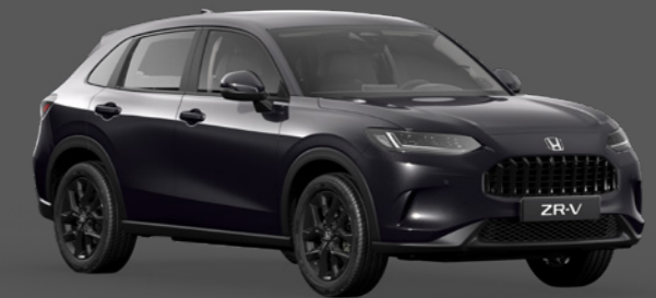
PREMIUM TWINKLE BLACK