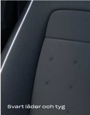
Svart läder och tyg