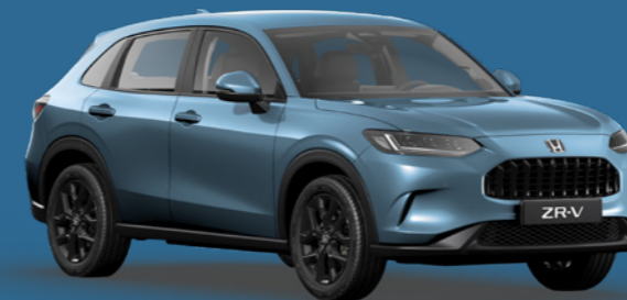
DENIM BLUE METALLIC