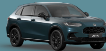
NORDIC FOREST PEARL